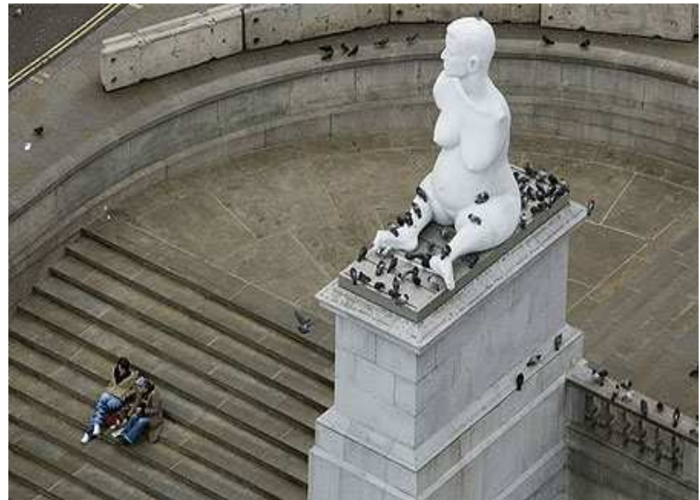
Marc Quinn – Londra -

IDENTITA' PLURALE IDENTITA' COMPETENTE IDENTITA' COME CO- COSTRUZIONE DI SIGNIFICATI DIMENSIONE INDIVIDUALE - SOCIALE