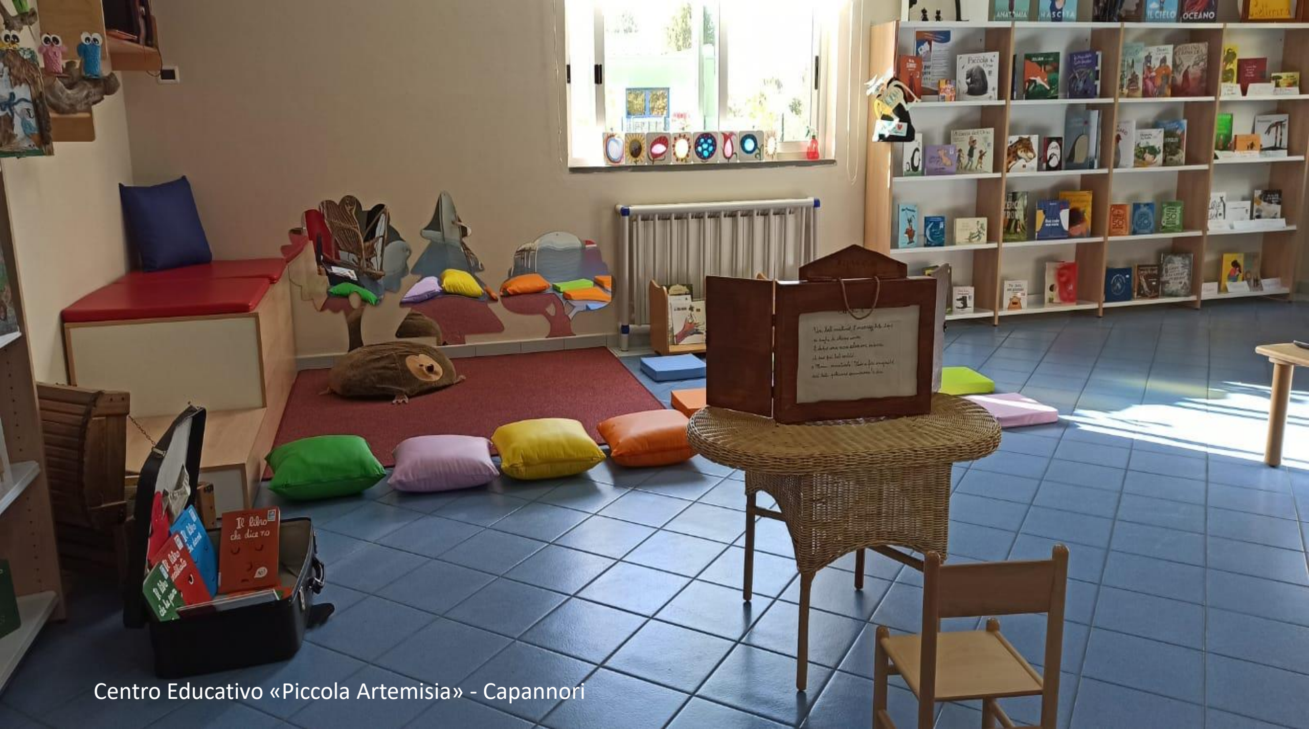
Centro Educativo «Piccola Artemisia» - Capannori