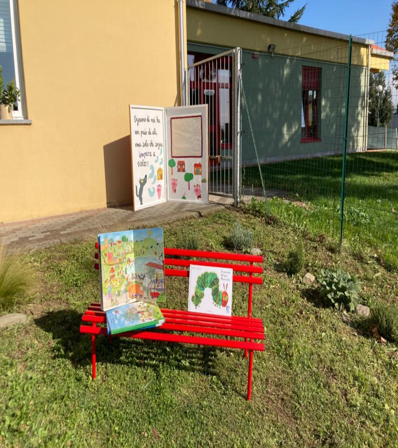
Centro Educativo «Piccola Artemisia» - Capannori